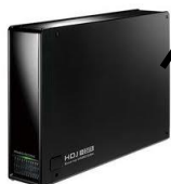
バックアップ装置